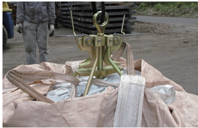
自動での玉掛け外し