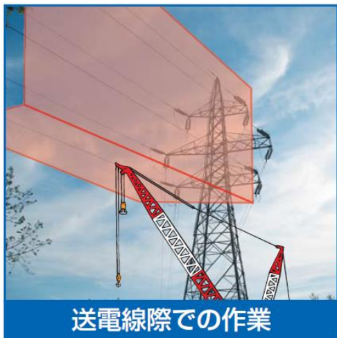
送電線際での作業