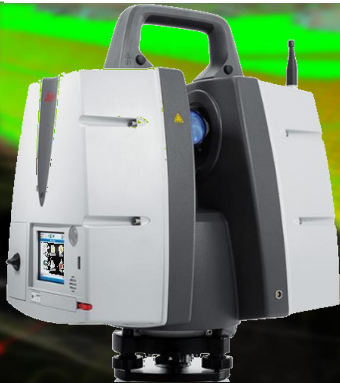
Leica ScanStation P40