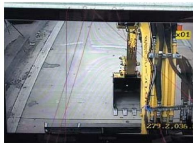
CONDOR映像を利用した遠隔操作状況