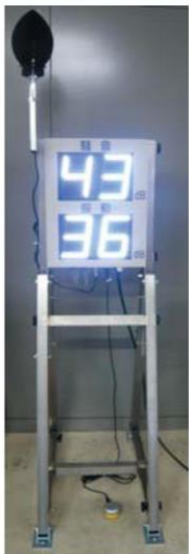
<スタンド設置の場合>