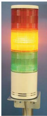
<LED表示灯> (オプション)